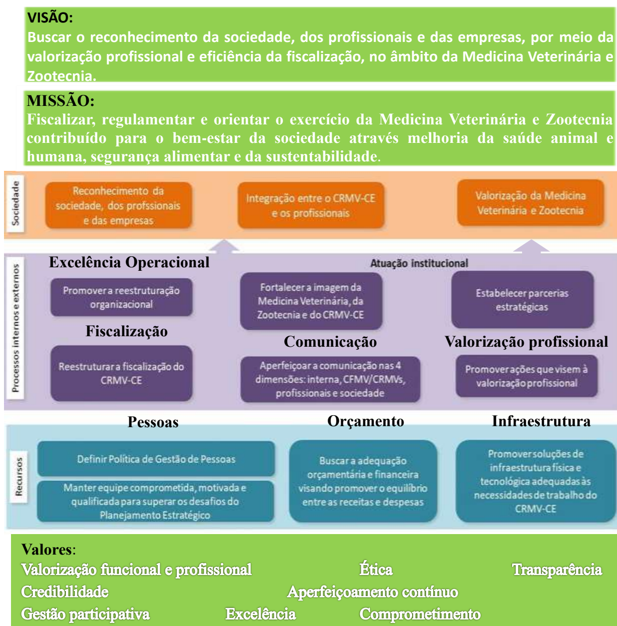
Figura 3 – Mapa Estratégico

Fonte: Coordenadoria Administrativa do CRMV-CE.